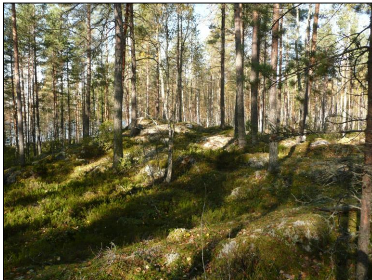
Kaarankajärven länsirannan niemen aluetta. Matalaa kalliota ja moreenia.