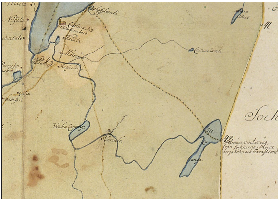
Ote pitäjänkartasta v. 1773. Kaarankajärvi oik. alh. Järven yli on mennyt talvitie Hämeeseen.