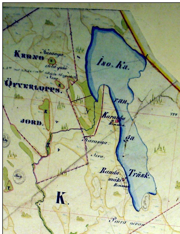
Ote pitäjänkartasta 1840-luvulta