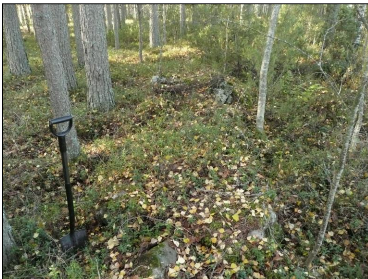
Sammaloitunutta kiviainan jäännettä